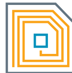
RFID (Radio Frequency Identification)